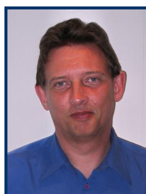
Motionist og Veteran